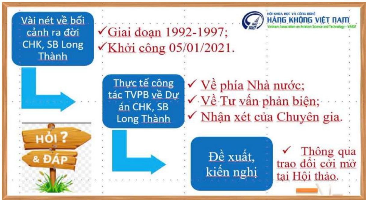
Hình 03: Tham khảo hoạt động TVPB&GĐXH tại CHK, SB Long Thành

Tóm lại: Tuy còn nhiều khó khăn trong hoạt động TVPB&GĐXH đối với các Hội ngành toàn quốc, xong Hội thảo khoa học cũng là lúc để các Hội ngành toàn quốc huy động nguồn lực từ các nhà khoa học, chuyên gia, đối tác tham gia đóng góp các ý kiến xây dựng, điều chỉnh, bổ sung chính sách cho phù hợp với tình hình mới thời kỳ hậu Covid-19 và chuyển đổi số, hội nhập quốc tế sâu rộng hiện nay nhằm đưa hoạt động TVPB&GĐXH ngày càng hiệu lực, hiệu quả hơn trong mọi lĩnh vực của đời sống kinh tế - văn hóa - chính trị - xã hội của quốc gia trong tình hình mới.