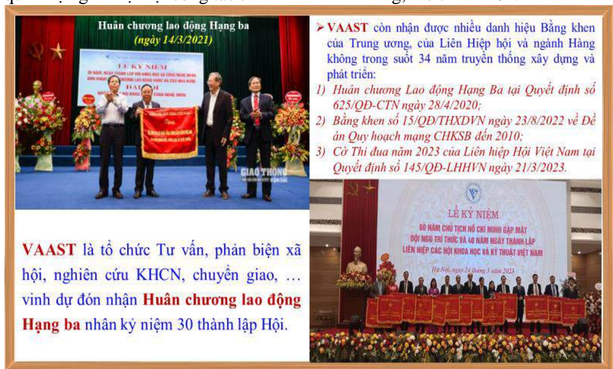
Hình 02: Thành tích thi đua, khen thưởng của VAAST nhiệm kỳ VI (2021-2025)

Bằng những nỗ lực của chính mình, cũng như định hướng và dẫn đường từ các cơ quan quản lý trực tiếp và gián tiếp, nhiệm kỳ đại hội VI (2021-2025) Hội Khoa học và Công nghệ Hàng không Việt Nam đã đạt được những thành quả được ghi nhận tại công tác thi đua - khen thưởng, mô tả hình 02: